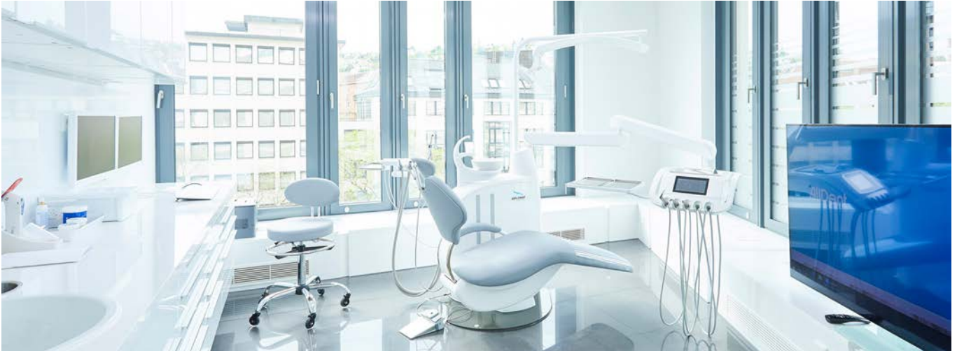
AllDent Holding GmbH

Sämtliche Inhalte dieser Seite sind ein Angebot des Anzeigenpartners. Für den Inhalt dieser Seite ist nicht das Handelsblatt verantwortlich.