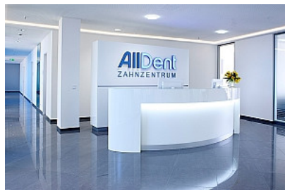
Zahnarzt 2.0 in Hamburg

Die Zahnmedizin beschäftigt sich sowohl mit der Vorsorge und Kontrolle als auch mit der Behandlung von Erkrankungen im Zahn-, Mund- und Kieferbereich. In manchen Fällen überschneidet sich die Zahnmedizin mit der Mund-, Kiefer- und Gesichtschirurgie. Auch bei einigen Erkrankungen des Körpers können sich erste Symptome im Mund äußern. In diesen Fällen stellen Zahnärzte eine Überweisung an den Allgemeinarzt. Für Patienten ist ein guter Zahnarzt